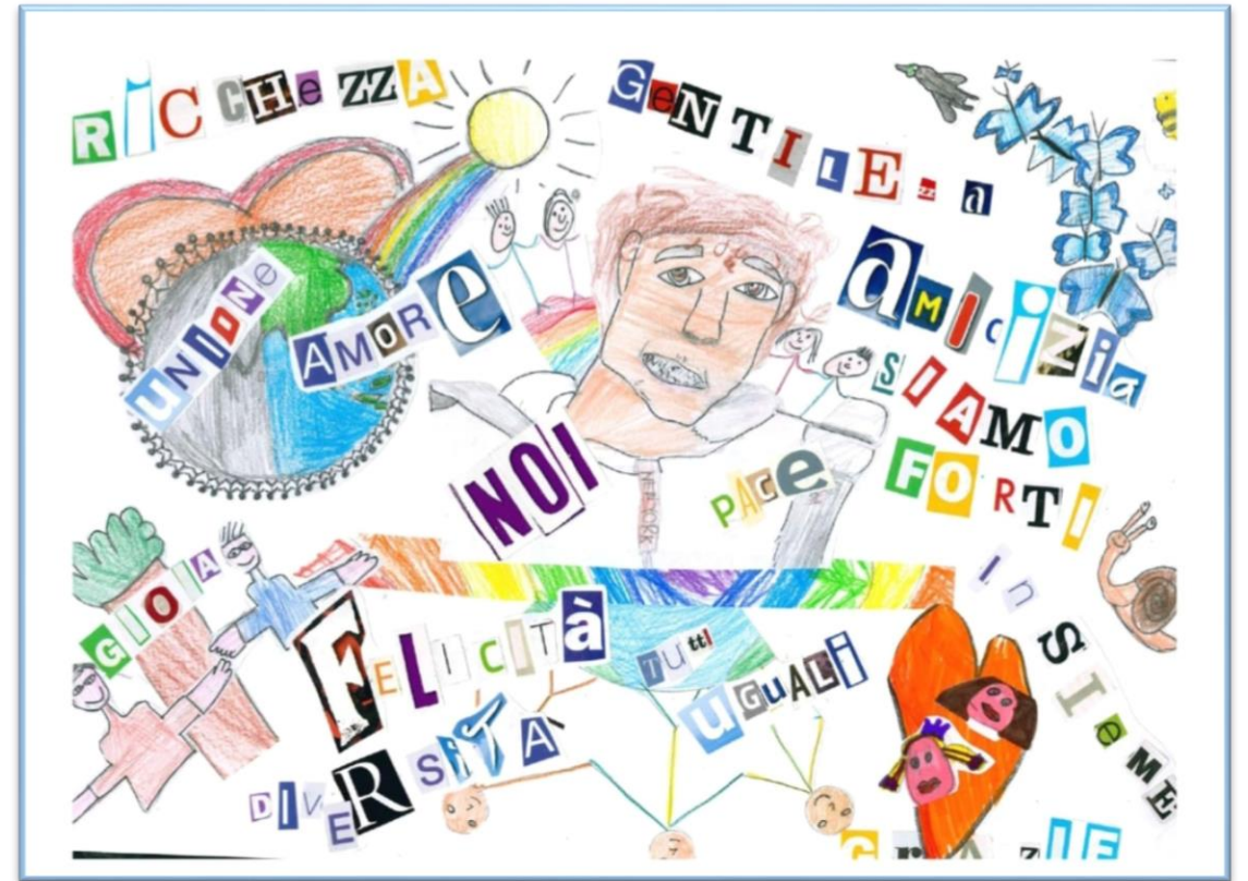
N°13 – “Mettil il cuore al centro del tuo mondo” Classe 5A – Scuola Primaria G. Carducci – Piano del Quercione