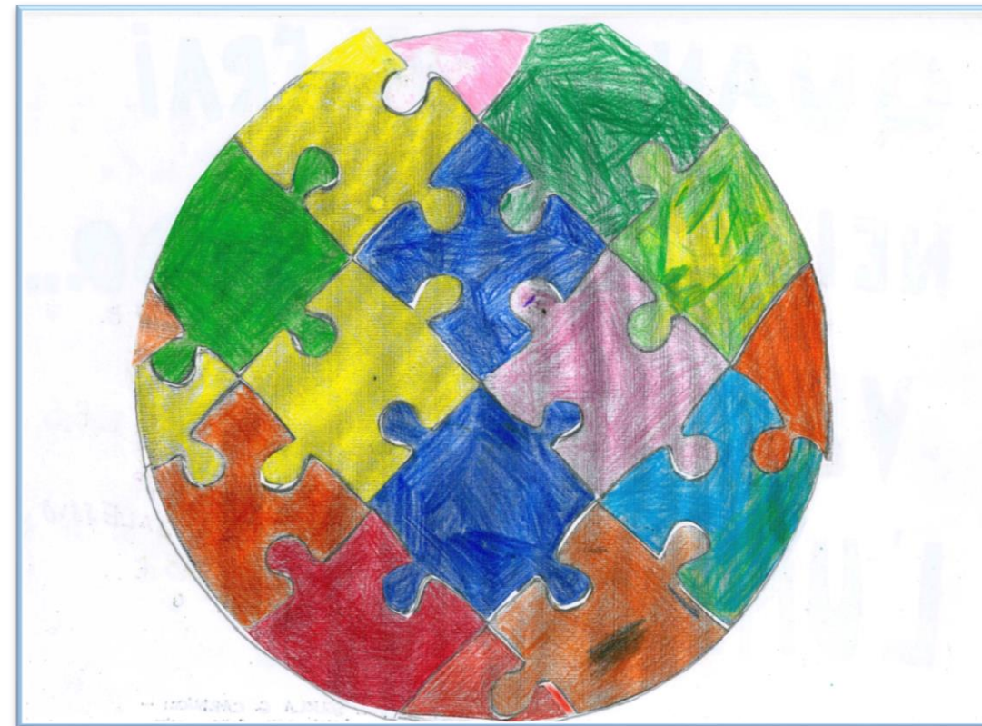
N°10 – “Quando entrerai nel mio mondo...vedrai l’universo” Classe 1A – Scuola Primaria G. Carducci – Piano del Quercione