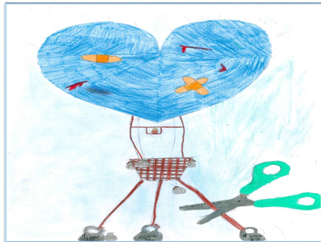
N°6 – “Nulla ci impedirà di volare!” Classe 4B – Scuola Primaria don A. Mei – Bozzano