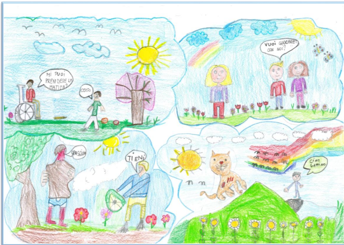
N°9 – “Il mio sorriso nel tuo cuore” Classe 4A\B – Scuola Primaria A. Manzoni – Massarosa