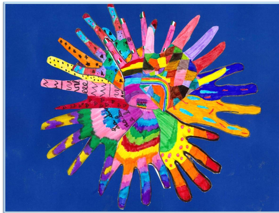
N°7 – “Un sole per l’autismo” Classe 5A – Scuola Primaria don A. Mei – Bozzano