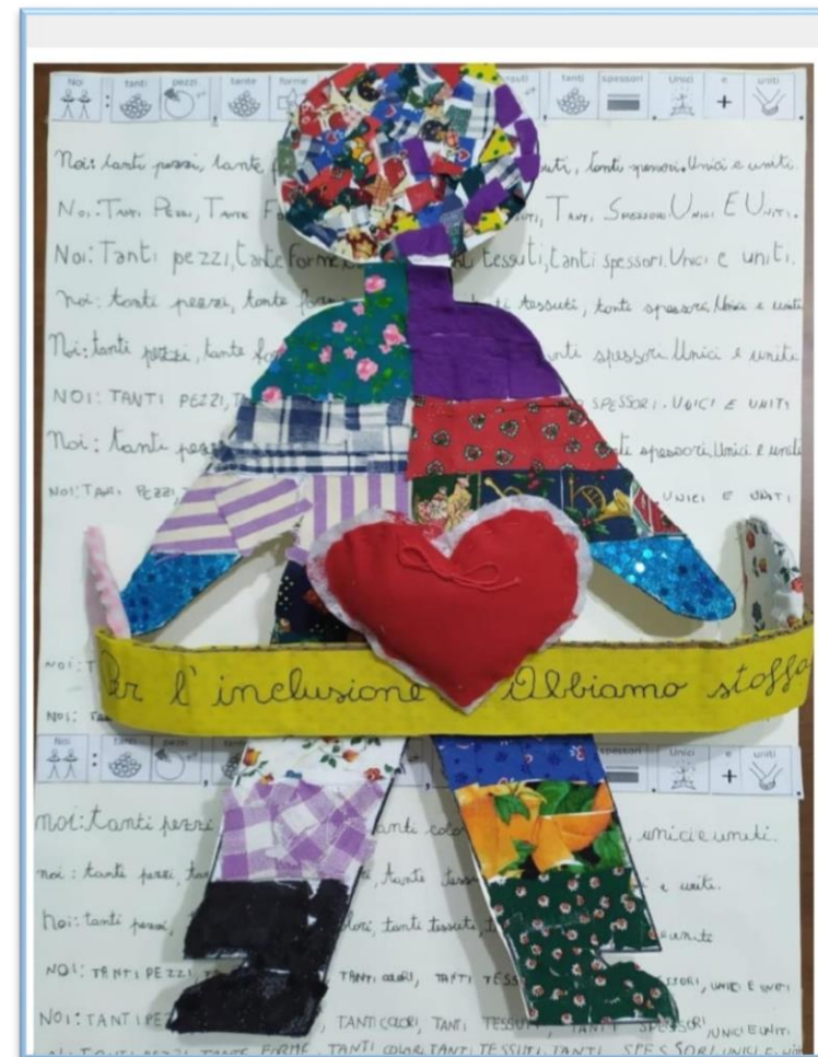
N°16 – “Per l’inclusione abbiamo stoffa” Classe 5A – Scuola Primaria M. D’Azeglio– Pieve a Elici