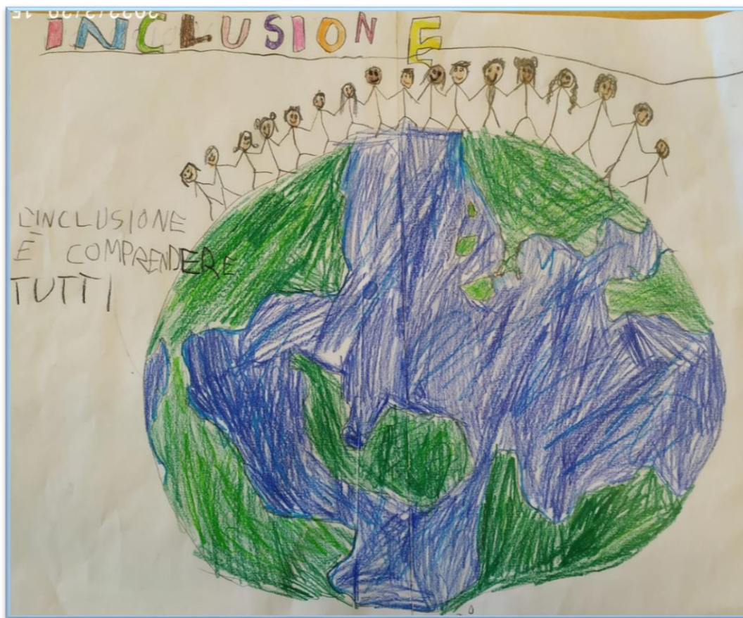
N°3 – “L’inclusione è comprendere tutti” Classe 2A– Scuola Primaria don A. Mei – Bozzano