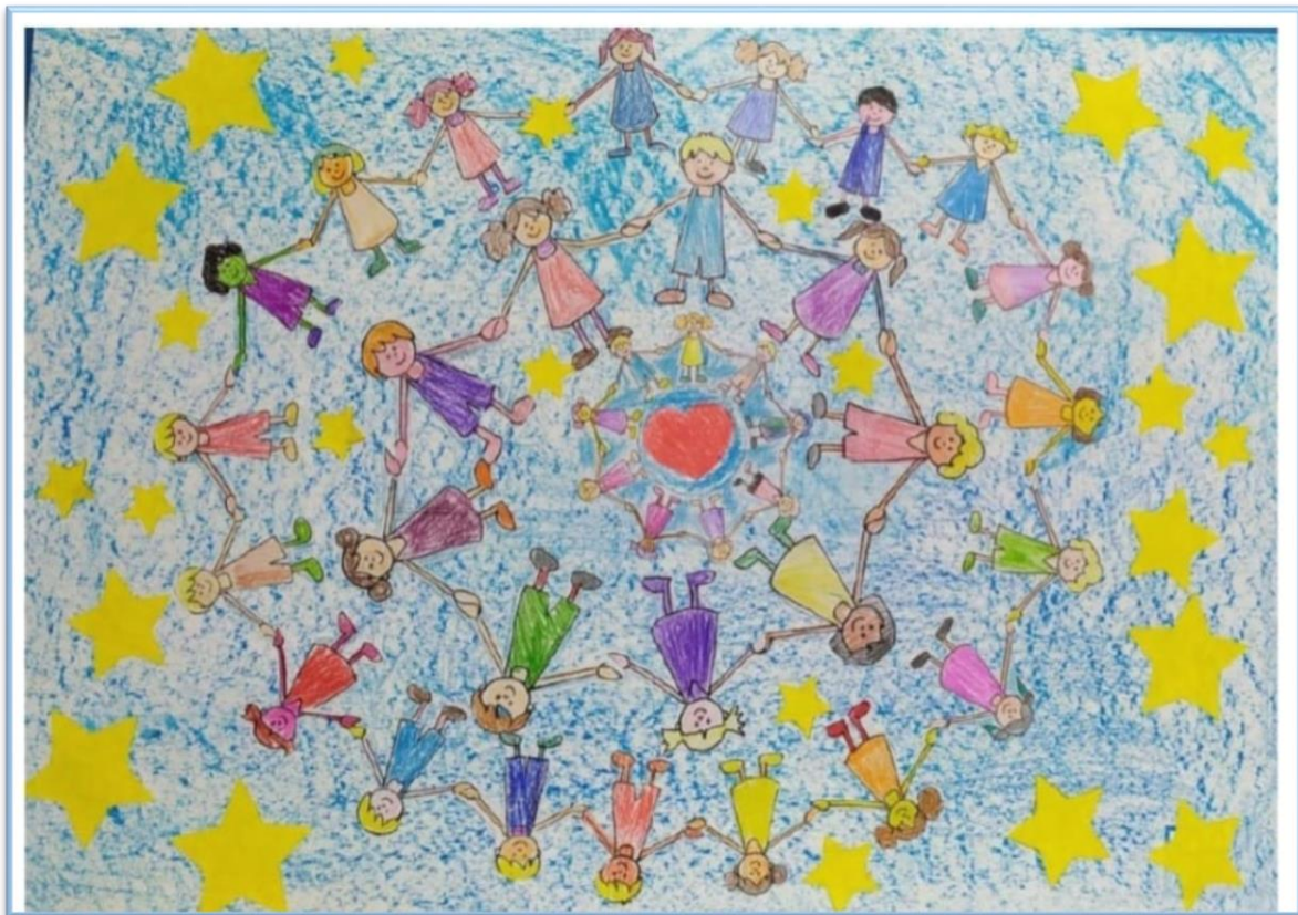
N°15 – “Uno per tutti, Tutti per uno, Perché non resti Indietro nessuno !!!” Classe 4A – Scuola Primaria M. D’Azeglio– Pieve a Elici