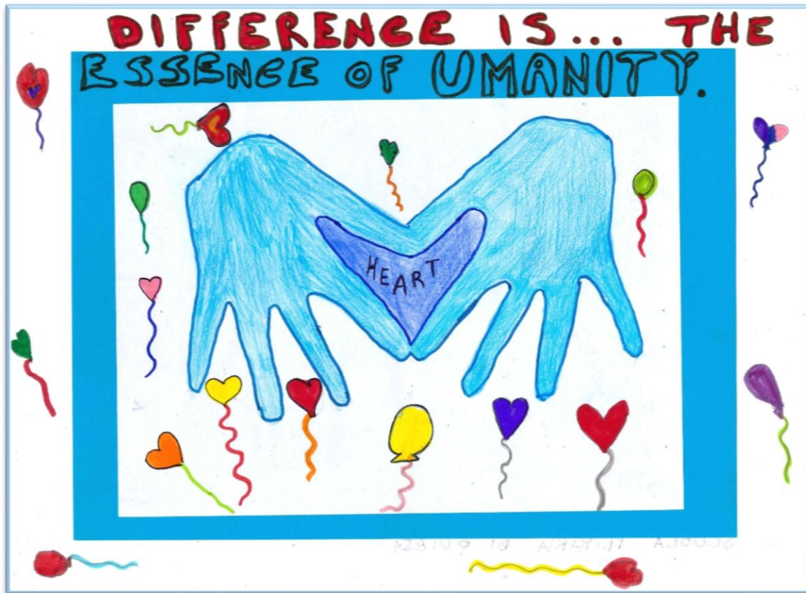
N°19 – “Difference is...the essence of umanity” Classe 3A Scuola Primaria San Giovanni B. – Quiesa