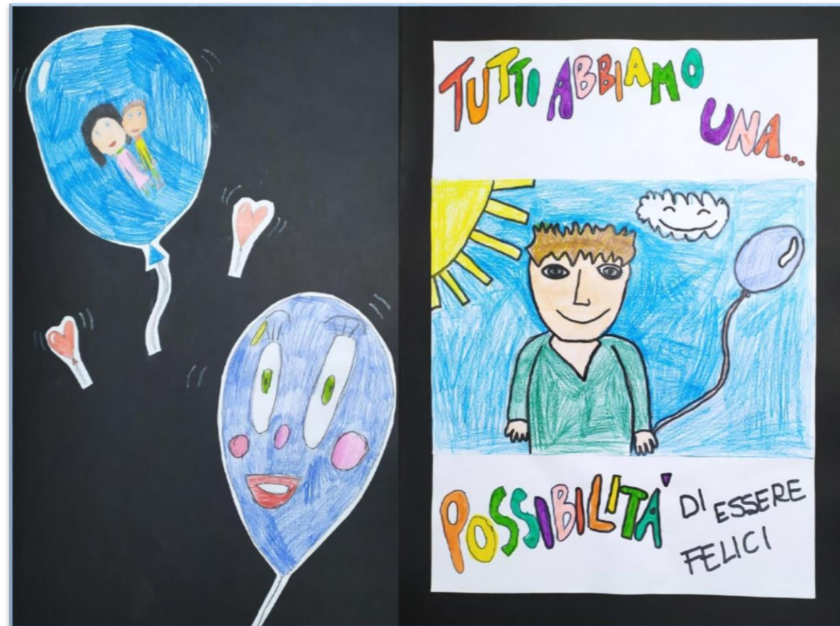
N°4 – “Tutti abbiamo una possibilità di essere felici” Classe 3A– Scuola Primaria don A. Mei – Bozzano