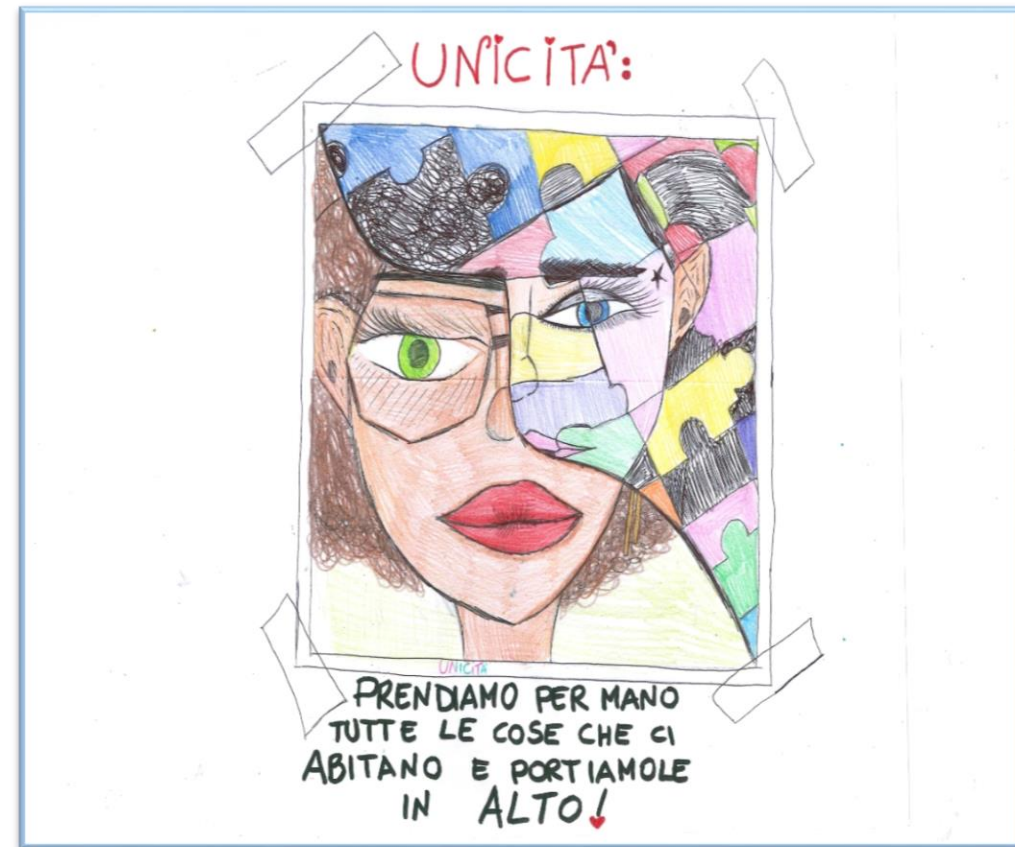
N°20 -“Prendiamo per mano tutte le cose le cose che ci abitano e portiamole in alto!” Classe 5A Scuola Primaria San Giovanni B. – Quiesa